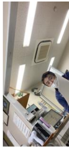
他人が写っている