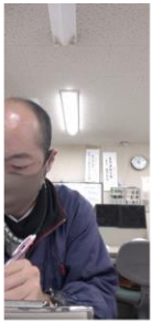
顔が見切れている