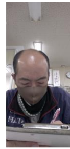
メモを取るために 下を向いている